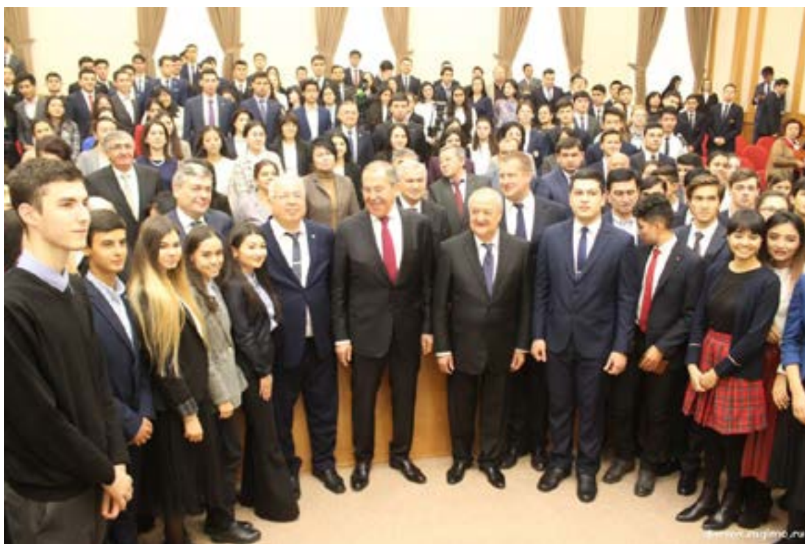
Ташкент. Филиал МГИМО. Снимок на память.

Встреча нашего министра с ребятами из местного отделения МГИМО и нескольких других вузов (зал был набит до отказа) прошла живо, интересно и тепло. А началась она с общего исполнения гимна МГИМО, слова и музыку которого написал С.В.Лавров. Даже на довольно бестолковые и наивные вопросы Сергей Викторович отвечал спокойно и обстоятельно. Кстати, в преддверии этой встречи среди студентов прошёл конкурс на право задать министру вопрос. Ожив-