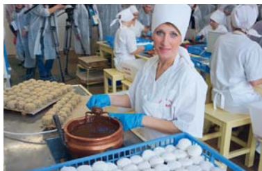
Зефир ручной работы выпускают в Бобруйске