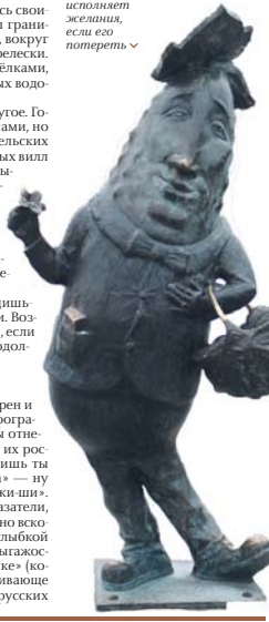
Бронзовый памятник огури в Шклове исполняют железных, если его попереть

Мы нечасто слышали национальный язык: чиновники, врачи, учителя, рабочие говорили с нами по-русски. Русский язык в Беларуси не иностранен, и это не попытка кому-то пона-