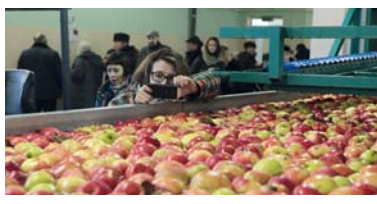
Яблоки, выращенные на Могилёвщине