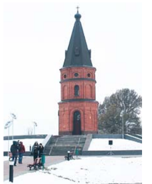
На Буйинском поле захоронены десятки немецких танков

И Бобруйск — старинная крепость, где был немецкий лагерь для советских пленных. Пронзительная скульптура: измождённый красноармеец утрачивает полый шинели умирающего товарища — обнуляя кожей солдат безвольно склонившейся головой. Не стоит напоминать белорусам о войне — они будут последними, кто её забудет.